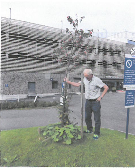
Ås: Rogn, 3 år - 7-8 cm for djupt