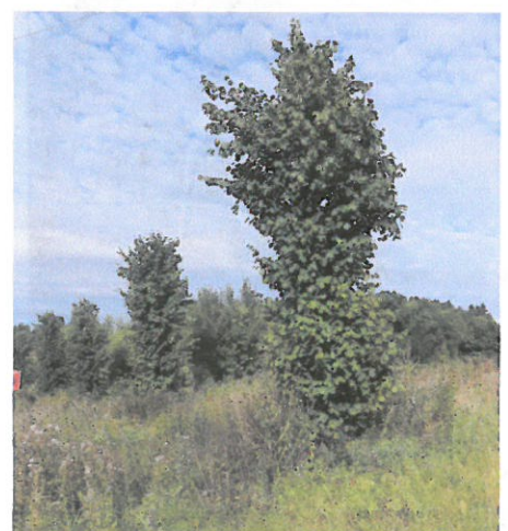
Vestby: Lind, 6 år - 10 cm for djupt