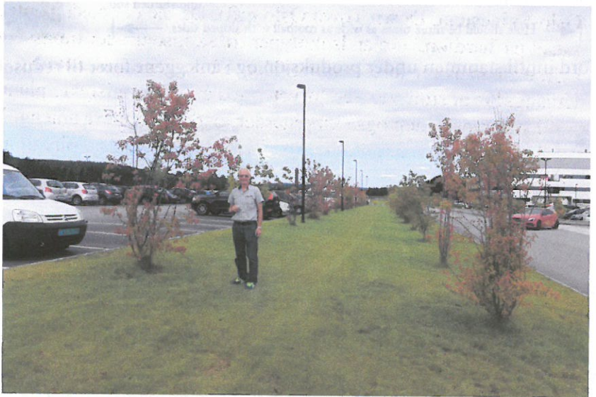
Østfold sjukehus: Sibirlønn, 3 år - 7-8 cm for djupt plantet.