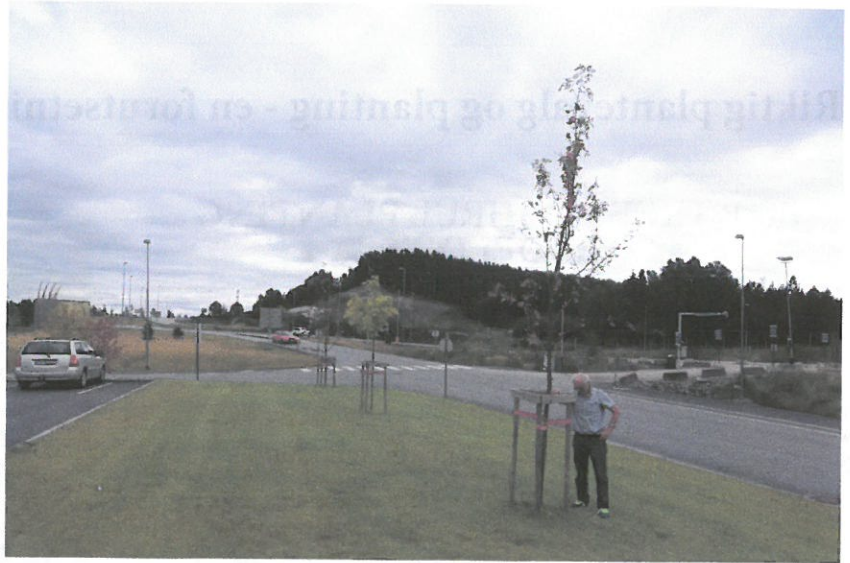
Østfold sjukehus: Rogn, 3 år - 7-8 cm for djupt plantet.