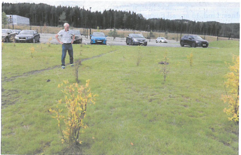
Østfold sjukehus: Sargentepple, 3 år - 7-8 cm for djupt plantet.