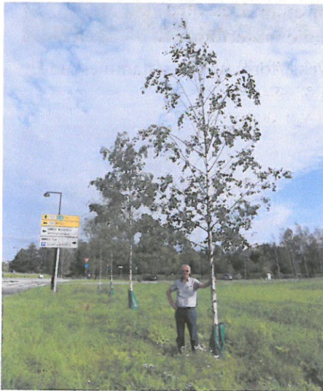
NMBU: Bjørk, 3 år - 7-8 cm for djupt