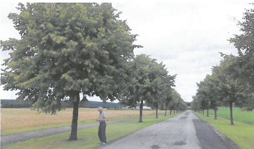
Kalnes: Lindeallé, 15 år - riktig plantet