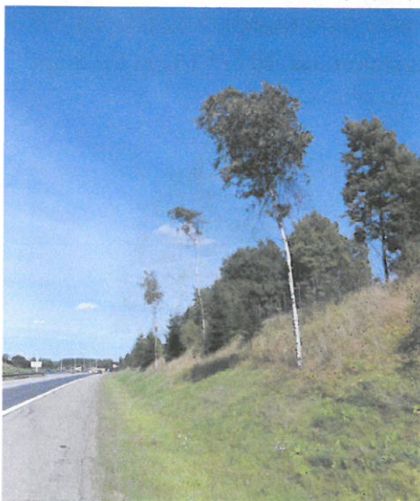
E6 Ås: Bjørk, 20 år - for djupt plantet feil økotype, saltopptak fra jord.