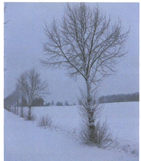
Rustad: Lind, 20 år - 15 cm for djupt